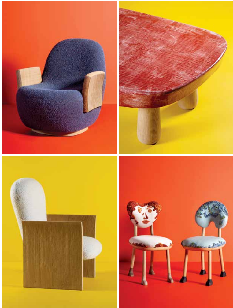
En sentido horario Sillón MAD. Coffee table Laziness. Sillas Catherine Oops (izquierda) y Gérard Oops (derecha). Sillón Flirting. Página opuesta Taburetes Joy.