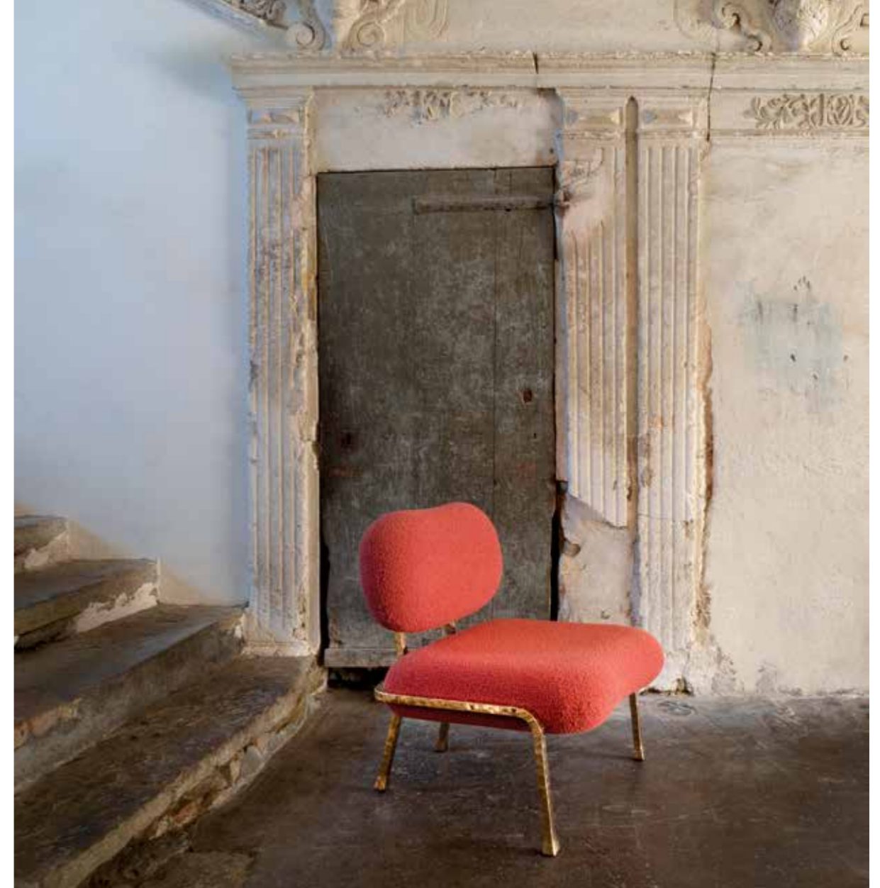
Arriba Sillón Clifford, otomana Hopper y mesita Topsy. Página opuesta Silla Hopper.

Muchas veces la paciencia es una de las claves del éxito. Es el caso del renombrado arquitecto de interiores Pierre Yovanovitch, quien cumplió un sueño en mayo pasado al lanzar su marca de mobiliario, iluminación y accesorios para la casa. “Quería esperar el momento perfecto. Estas piezas nacieron inicialmente como una manera de asegurarme que los elementos de diseño (para los espacios interiores de mis clientes) fueran de alta calidad y únicos, pero poco a poco se volvieron una forma de expresión creativa en sí mismas. Pierre Yovanovitch Mobilier me va a permitir compartir estos diseños con más personas”, expresó el francés.