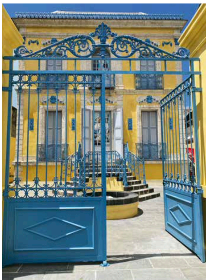
Décor de Pierre Yovanovitch pour Rigoletto , de Giuseppe Verdi.