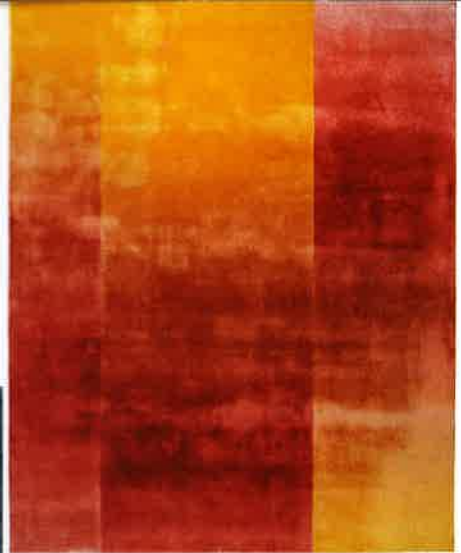
↑ Coucher de soleil "Shifting Ombre" en soie, à partir de 244 x 300 cm, prix sur demande, CREATIVE MATTERS.