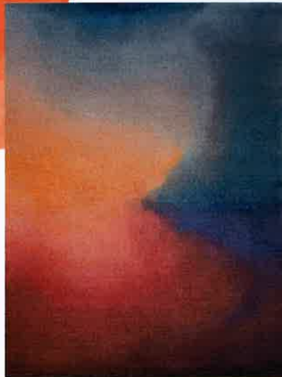
← Aurore boréale "Aurora Hibiscus" en soie végétale, collection Chromatic, 300 x 400 cm, 2 3587 €, EDITION BOUGAINVILLE.

Dans l'esprit de William Turner, les tapis dessinent un horizon dans tous ses états.