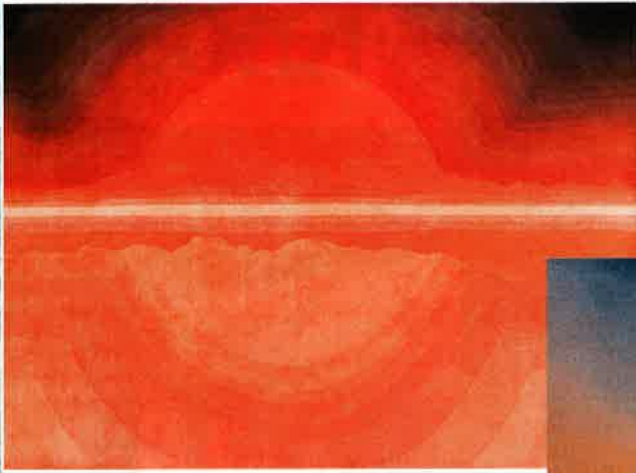
← Crépuscule "Sunset" en laine, design Alejandra Gandía-Blasco, à partir de 2 900 € en 170 x 240 cm, GAN.