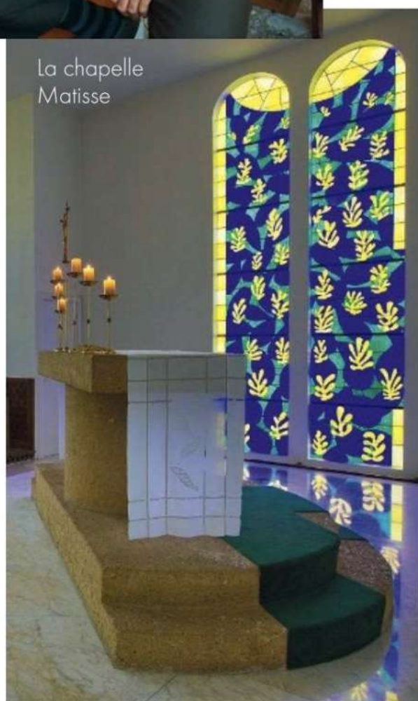
La chapelle Matisse

■ Avenue Jacques-Chirac, Rayol-Canadel-sur-Mer.